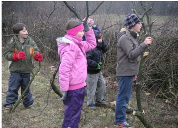
„Was So viele kommen zum Aktionstag?“